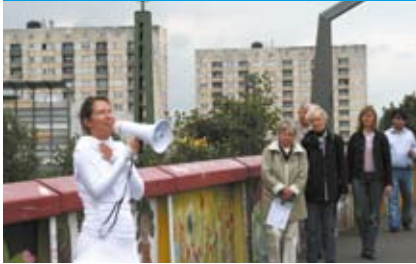
Die Gräfinnen von Wilhelmsburg – eine Performance des IBA Kunst & Kultursommers 2007