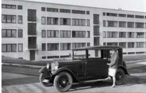
Mies van der Rohe, Apartmenthaus, 1927