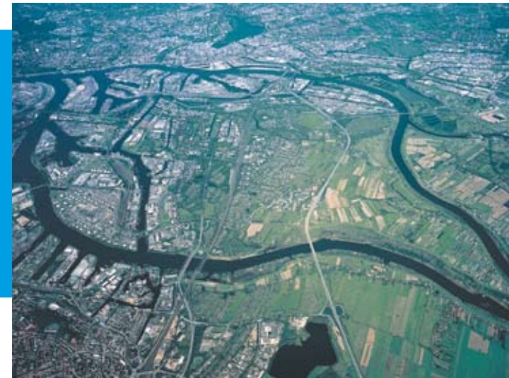
IBA Gebiet aus der Vogelperspektive