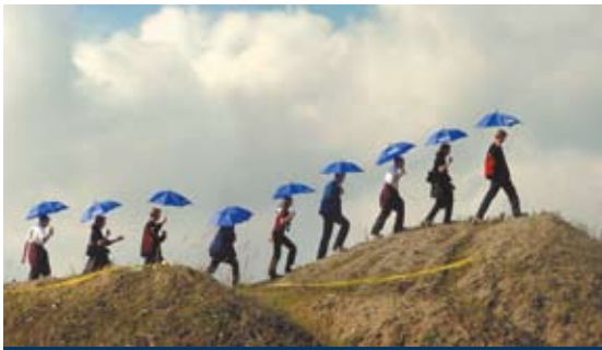
Ergebnisse der „Werkstatt für neue Landschaften“, 2001