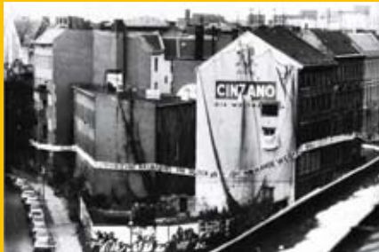
Hausbesetzungen im Block 89 rund um das Fränkelufer in Kreuzberg, 1981