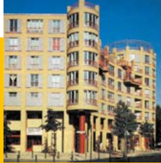
Gottfried Böhm, Wohnbebauung am Prager Platz