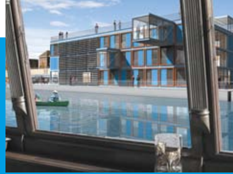
In Planung – Schwimmende Jugendherberge und IBA_DOCK