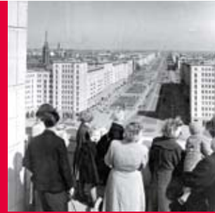
Blick auf die Stalinallee